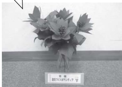
ポインセチアの造花