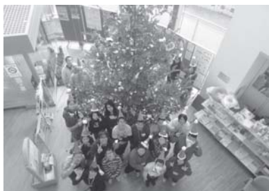
みんなでツリーの飾りつけ！ 綺麗にできました！

いこいのひろばは、都留文科大学の学生ボランティアをはじめ、地域のボランティアの方たちと地域に住む障がいを持っている人たちが楽しく充実して過ごせる場所となっております。文化やスポーツなど様々な活動をしています。平成28年12月11日（日）は、いきいきプラザ都留において、クリスマスツリーの飾りつけをしました。夕方には点灯し、綺麗に輝いていました★