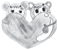
都留市ボランティアマスコット