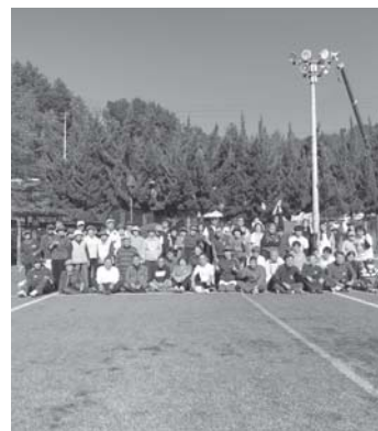
暑かったけど、楽しく 交流できました！

年々参加人数が増えていますので、興味のある方は、ぜひ一緒に身体を動かしましょう！