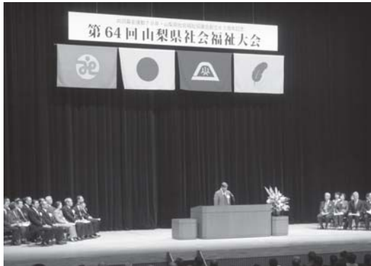
山梨県社会福祉大会式典の様子