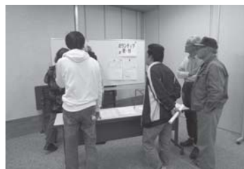
災害ボランティアセンター 設置・運営訓練の様子

当日は19名のスタッフボランティアが参加され、講義では、「都留市の自然災害」「災害ボランティアの役割」「災害ボランティアセンター設置・運営」について学びを深め、訓練として「災害ボランティアセンター設置・運営訓練」を行い、実践力の向上に取り組みました。