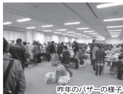
昨年のバザーの様子

忘年会シーズンが近づいておりますが、自治会や職場で開催する催しの景品としても素敵な物品が沢山あります。ぜひこの機会にお買ひ求めください。お待ちしております。