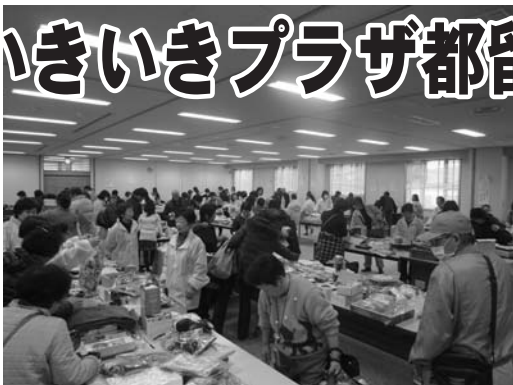
(昨年のバザーの様子)