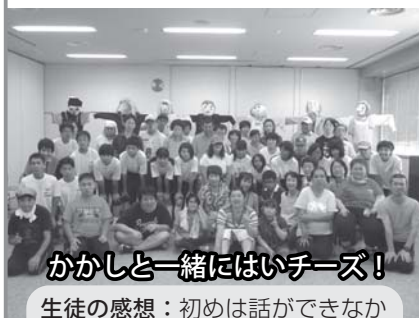
がかしと一緒にはいチーズ！

午後 障害福祉サービス事業所みとおしの利用者として協力して大きながかしを作りました。