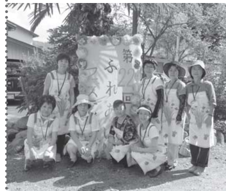
ボランティアコーディネーターの皆様です

平成27年8月22日(土)、回生堂病院において、地域交流事業の一環として「ふれあいフェスティバル」が開催され、運営面に協力するボランティアとして地区ボランティアコーディネーターの皆さんに活動していただきました。