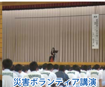
災害ボランティア講演

平成27年8月27日(木)、山梨県立谷村工業高等学校・山梨県立都留興譲館高等学校・山梨県立桂高等学校の生徒を対象に、高校生災害ボランティアスクールを開催しました。