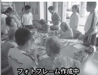
フォトフレーム作成中

生徒の感想：お年寄りといふれあい、とても楽しくできました。利用者の方も喜んでくれてよかったです。